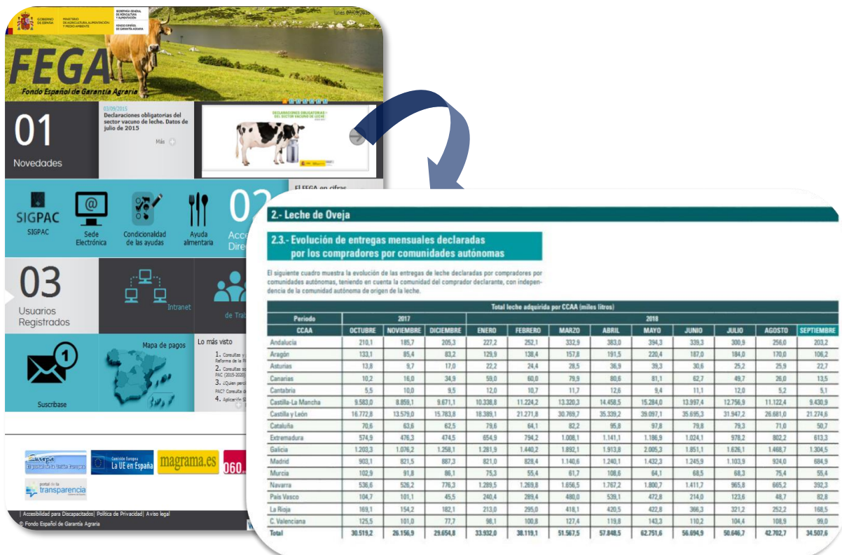
Imagen 5. Boletín Declaraciones obligatorias ovino de leche del FEAGA.