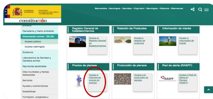
Imagen 1. Sistema Informático de Registro de establecimientos en alimentación animal (SILUM).

De toda la información publicada, la SGPG emplea el precio de la ración completa para el ovino de leche, que se actualiza semanalmente tomando como base las modificaciones de precios que se producen en los principales cereales para piensos y la harina de soja, en las cotizaciones de la lonja de Mercolleida, ubicada en el área en la que se encuentra la mayor concentración de producción de piensos de España. Finalmente, se estiman los costes de alimentación mensuales a partir de la media aritmética de los valores semanales publicados.