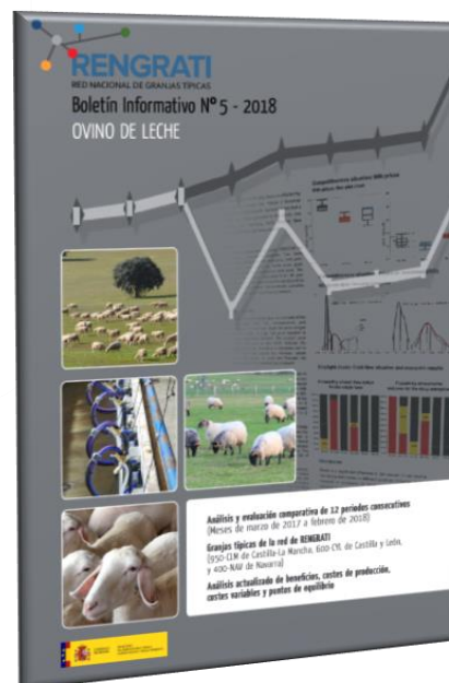
Imagen 3. Boletín Informativo de ovino de leche, RENGRATI.